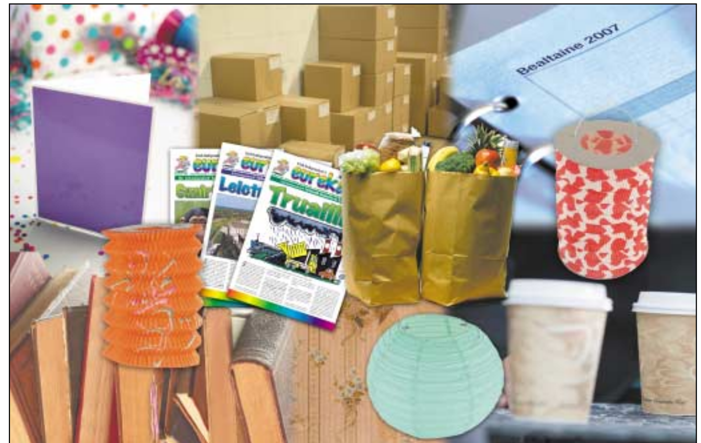
Páipéar na maidine, páipéar an lae, páipéar um thráthnóna ...

Le 2000 bliain anuas, tá páipéar in úsáid agáinn. Is sa tSín a d'úsáid daoine páipéar ar dtús. Dar le scéal amháin, bhris na Síniigh síos an choir (bark) ó chrainn maoidéirge (mulberry) go raibh si ina snáithníní (fibres). Ansin thuarnaigh (pounded) siad na snáithníní le chéile go raibh siad ina mbileog (sheet). Chroch siad na bileoga suas ansin go dtí go raibh siad tirim. Fuair na Síniigh amach go raibh an páipéar níos fearr nuair a mheasc siad ceirteacha