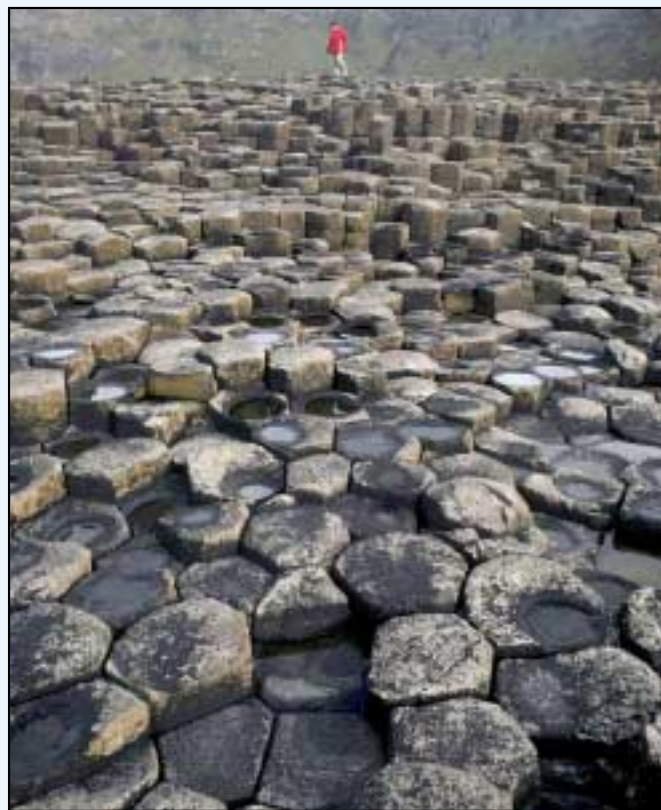
Bealach an Fhathaigh