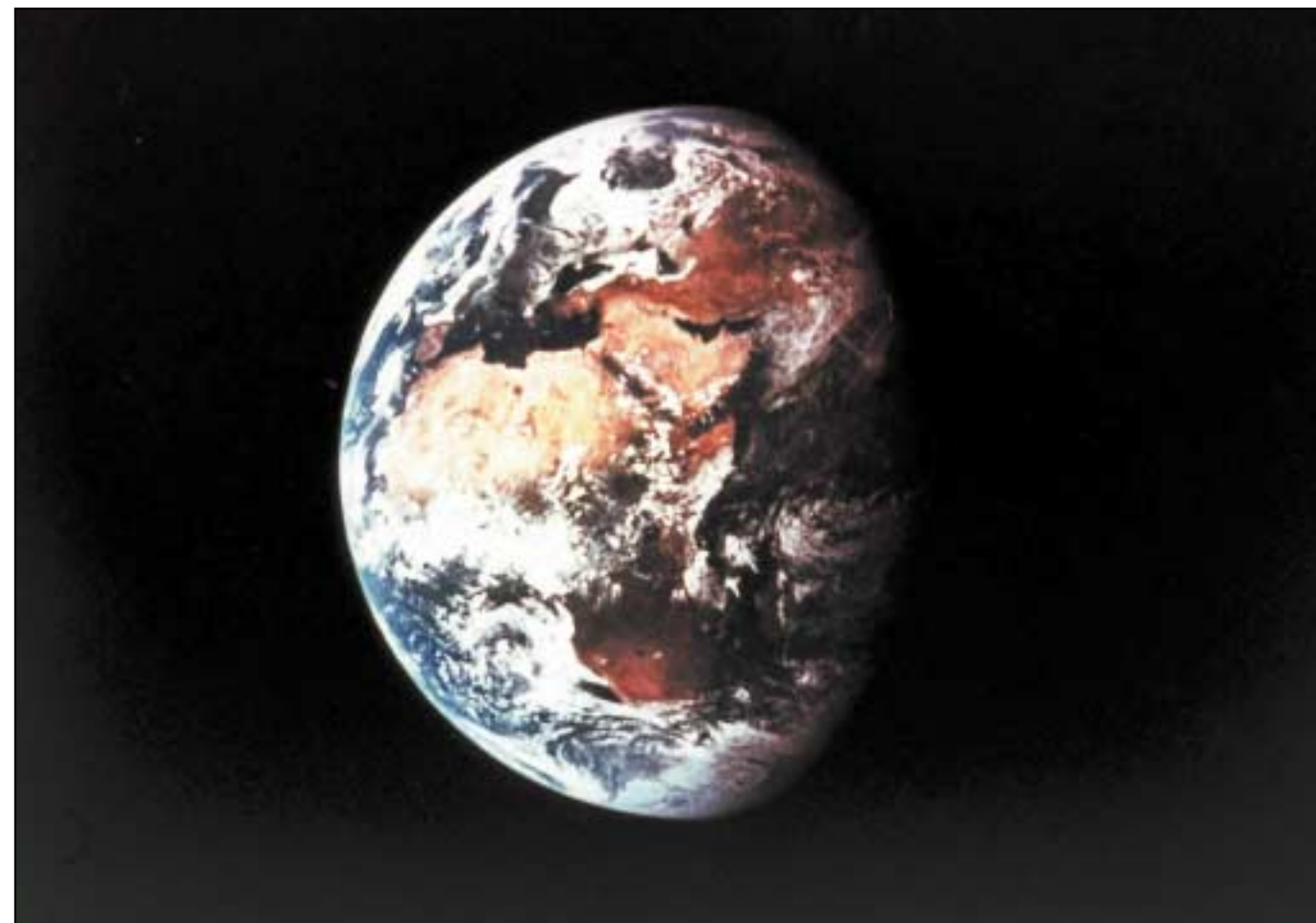
Is é an Domhan an tríú 'carraig' amach ón nGrían

Tá cónaí ar na milliúin duine, ainmhi agus planda anseo ar an Domhan. Ni fios dúinn go cinnte go bhfuil beatha (life) ar aon phláinéad eile inár gcruinne (universe) ach amháin ar an Domhan. Carraig is ea an t-ábhar atá sa Domhan. Tá plainéid charraigeacha eile sa ghrianchóras (solar system) – Véineas, Mars agus Mearcair. Ni plainéid charraigeacha iad na plainéid eile - Iúpatar, Satarn, Úránas agus Neiptiún. Is liathróidí móra gáis iad na plainéid sin.