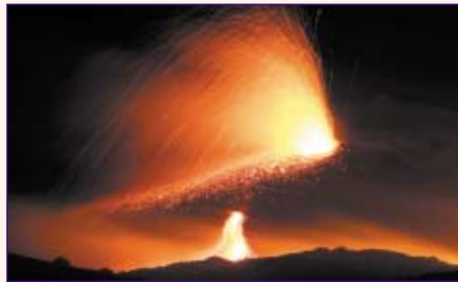
Bolcán Shliabh Etna (ar oileán na Sicile i ndeisceart na hIodáile) ag briseadh amach mí Iúil 2006

an Domhain. Uaireanta nuair a bhíonn an bolcán ag briseadh amach, preabann carraig leachtach amach as barr an bholcáin mar phléasc mhór. Uaireanta eile, sileann (flows) sí síos taobh an bholcáin agus fuaraíonn (cools) sí de réir mar a shileann sí. Nuair a fuaraíonn an laibhe, athraíonn sí go carraig sholadach (solid) bholcánach. Tugann eolaithe an t-ainm bruthcharraigeacha (igneous rocks) ar na carraigeacha seo.