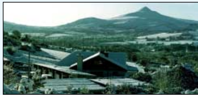
Ó Cualann, Co. Chill Mhantáin