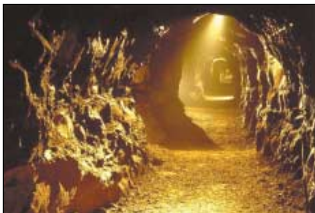
Le caoinchead Forbairt na Sionna

Bionn fáilte roimh chuairteoirí in uaimheanna áirithe. Ar an liosta seo, tá roinnt de na huaimheanna in Éirinn ar féidir cuairt a thabhairt orthu. Féach ar d'atlas go bhfeicfidh tú cá bhfuil siad. An bhfuil cónaí ort in aice le haon cheann acu?