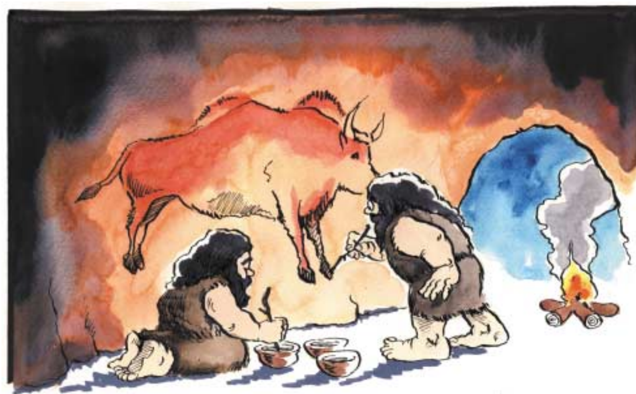
"Ar thug Mamá cead duit bheith ag peintéireacht ar an mballa?"

Ní hiad na daoine fásta amháin a thagann ar (discover) rudai nua tábhachtacha. Os cionn céad bliain ó shin, bhí cailín beag Spáinneach ag taiscéaladh (exploring) fheirm a hathar nuair a tháinig sí ar uaimh (cave). Chuaigh sí isteach san uaimh agus chonaic sí go raibh ealain ar na ballaí. Níor thuig sí, ag an am, go raibh sí tar éis teacht ar shamplaí den péintéireacht is