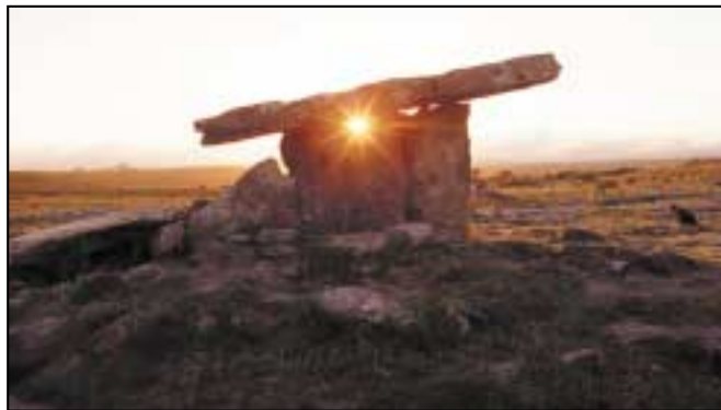
Le caointhead Fálte Ireland

Is minic a bhíonn uaimheanna i gcarraigeacha aolchloiche (limestone) mar tá aolchloch níos boige ná formhór na gcarraigeacha eile. Creimeann (wears away) uisce báistí an aolchloch diaidh ar ndiaidh. Nuair a thiteann uisce ar an talamh, bogann sé síos trí gháganna (cracks) agus trí shiúntaí (joints) sa charraig de ghnáth. De réir a chéile, éiríonn na gáganna níos mó go dtí go mbíonn poill mhóra san aolchloch. Nuair a bhíonn na poill chomh mór sin gur féidir le duine dul isteach iontu, tugaimid uaimheanna orthu.