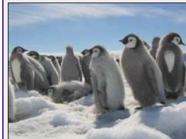
Piongainí impireacha óga

B'eireann éin uibheacha agus suíonn siad ar na huibheacha chun iad a choinneáil teolaí nuair a bhíonn na deacrachtaí a bhíonn ag éin Antartaice! Bíonn cónaí ar phiongainí impireacha (emperor penguins) in Antartaice agus bíonn sé deacair orthu a gcuid uibh a choinneáil teolaí. Ní bhíonn aon rud le fáil acu chun nead a dhéanamh - bheadh oighear rófhuar róchrúa. Mar sin, nuair a bheireann an mháthair ubh, tugann sí don athair í agus coinneáil seisean an ubh ar a chuid cos! Ní bhíonn an ubh i dteagmháil (in contact) leis an oighear fuar agus bíonn sí istigh faoi bhog bhog chlúmhach (feathery) an athair. Is mar seo a choinníonn sé teolaí í. Níl tada eile le déanamh aige ansin ach fanacht go foighneach ar feadh 65 lá, nó mar sin, go dtagann an piongain beag amach as an ubh. I rith an ama sin, seasann na háithreacha ar fad le chéile i gciorcal chun iad féin agus na huibheacha a choinneáil te. Cad a bhíonn ar siúl ag na máithreacha ag an am céanna? Bíonn siadsan ag taisteal na mílte agus na mílte ar ais chuig an bhfarraige chun bia a fháil don phiongain beag nuair a thiocfaidh sí amach as an ubh.