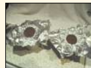
4. Seacláid sna múnlaí