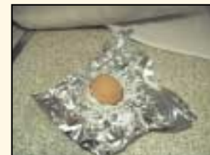
1. Fill an scragall thart ar an ubh chruabhruite

Is féidir uibheacha sheacláide a cheannach sna siopaí ó cheann ceann na bliana, agus go mórmhór um Cháisc. Ach cén fáth nach ndéanfá do cheann féin? Ba dheas an smaoineamh é ubh sheacláide a rinne tú féin a thabhairt mar bhronntanas do dhuine éigin. (Nó d'fhéadfá í a choinneáil duit féin!) Foghlaimid tú faoi sholaid (solids) agus faoi leachtanna sa gníomhaíocht seo freisin.