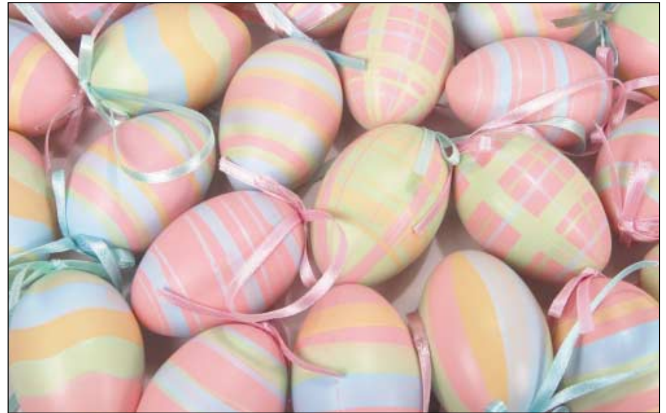
Uibheacha gleoilte na Cásca

Táimid leath bealaigh tríd an Earrach agus ní fada uainn anois an Cháisc. Tá na siopaí lán le bronntanais Chásca. Is í an ubh Chásca an bronntanas is coitianta. Bíonn seacláid sna huibheacha Cásca de ghnáth ach uaireanta feicfidh tú uibheacha déanta as mílseáin eile, as adhmaid agus as porceallán (porcelain / china) maisithe. Fadó, thosaigh daoine an nós seo – thug siad uibheacha mar bhronntanas ag an am seo den bhliain chun an tEarrach agus tús na beatha a cheiliúradh. Tagann na héin bheaga amach as na huibheacha san Earrach, agus tagann ainmhithe eile agus plandaí ar an saol san Earrach freisin. Déan liosta de na cinn atá ar eolas agat.