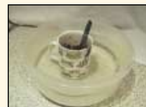
3. Ag leá na sheacláide