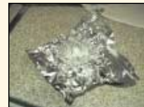
2. Múnla leathuibhe