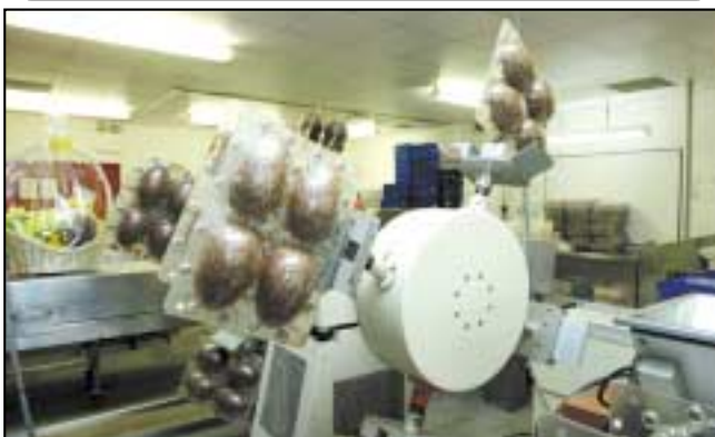
Ag déanamh uibheacha Cásca

An gceapann tú gur féidir leat an gealacán a athrú siar arís go leacht, mar a bhí sé nuair a bhris tú an uibh? Conas a d'fhéadfá é seo a thriail?