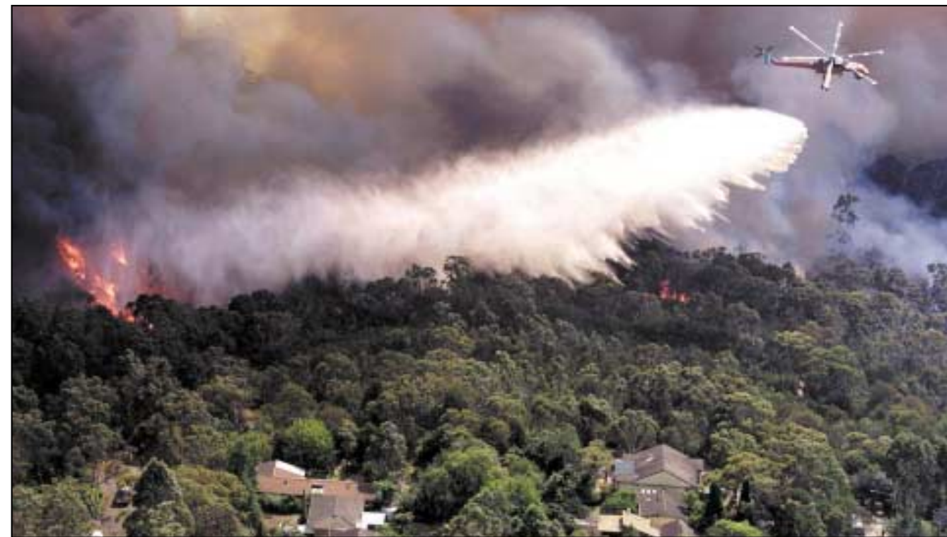
Doirteann héileatancaer ollmhor 9,500 lítear uisce anuas ar thinte atá ag bagairt ar thithe i Sydney na hAstráile.

A r léigh tú sna nuachtáin faoi na dóiteáin fhoraoise a scaip trí thiortha na hEorpa - an Spáinn, an Phortaingéil, an Fhrainc, an Iodáil agus an Pholainn ina measc - i rith an tsamhraidh? Bhí na tinte ba mheasa sa Phortaingéil. Bhí an aimsir te agus bhí na gaotha tirim, agus dá bharr sin, leath na tinte go han-tapa agus scrios siad na mílte crann. Dar leis na maoir fhoraoise (foresters) sa Phortaingéil, mhíl na tinte os cionn 215,000 heictear (531,000 acra) fhoraoise (níl Lucsamburg mórán níos mó ná seo). Rinne na céadta comhraiceoir dóiteáin (firefighters) a