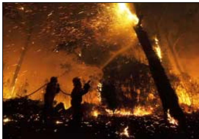
In Iarthuaisceart na Spáinne, dhoigh tinte fhoraoise níos mó ná 10,000 heictear (24,710 acra) fhoraoise agus scriobarnaigh (scrubland) in aon seachtain amháin. Seo iad na seirbhísí éigeandála ag dul i ngleic leis na tinte.

CEIST AGAINN ORT: An mbíonn salamandair le feiceáil in Éirinn?