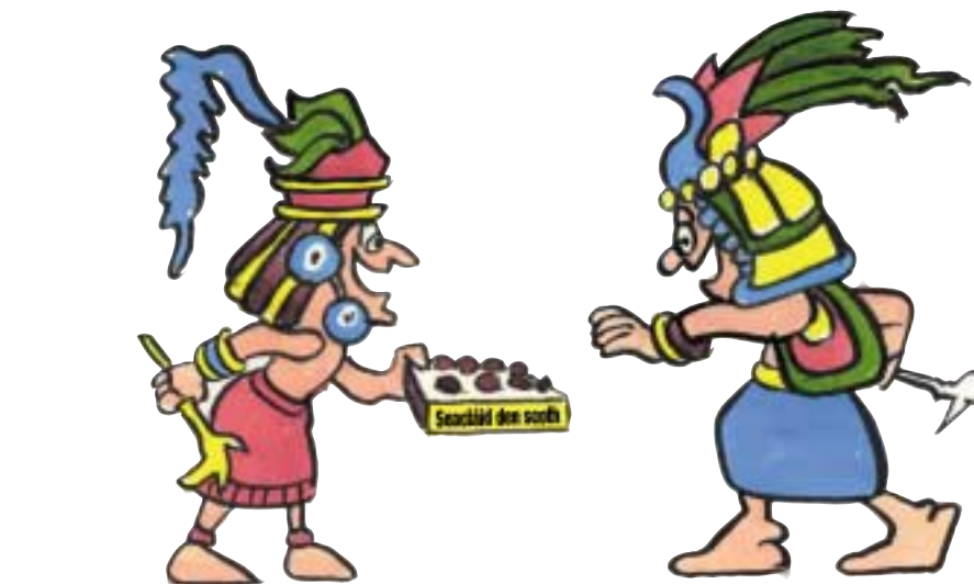
Tabharfaidh mise coinín duitse má thugann tusa na seacláidí sin domsa

Bhí luach an-mhór ar shiolta cócó fadó. Go deimhin, d'úsáid daoine iad go minic mar airgead. Cheannódh 4 shiol puimcín, cheannódh 10 siol coinín, agus d'fhéadfá sclábháil (slave) a fháil ar 100 siol!