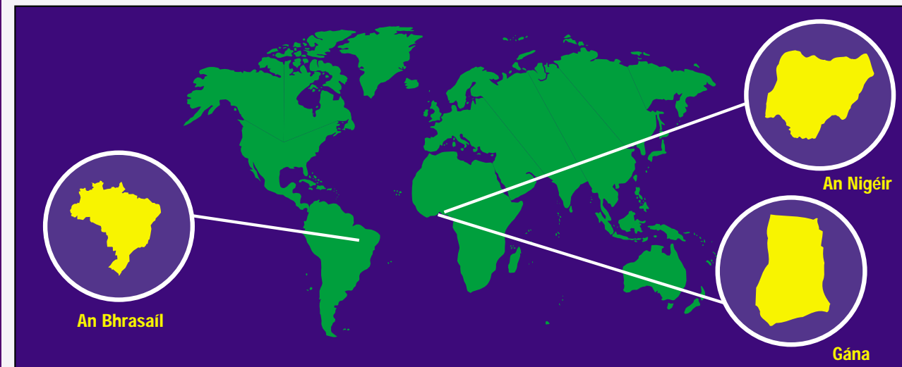
Cá bhfuil Éire ar an léarscáil seo? Nach fada an t-aistear a dhéanann seacláid?

Más mian leat eolas breise a fháil ar stair na seacláide agus conas í a dhéanamh, féach ar www.cadbury.co.uk