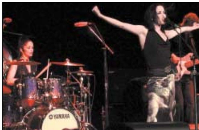
Is í Caroline Corr drumadóir an ghrúpa, The Corrs.