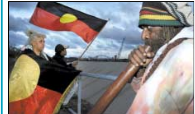
Fear bundúchasach (aboriginal) ag seinm ar an didgeridoo.