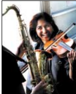
Cé mhéad tacar uirlise atá le feiceáil sna pictiúir thuas?

Bíonn téada, ar ndoigh, ag uirlisí téad . Nuair a chreathann na téada seo, déanann siad ceol. Is féidir na téada a phiocadh, mar a dhéanann tú ar ghiotár; is féidir bogha (bow) a úsáid orthu mar a dhéanann tú le fidil; is féidir iad a bhualadh le casúr mar a tharlaíonn taobh istigh de phianó. Is féidir na téada a theannadh (tighten) nó a scaoileadh (loosen) chun nótaí arda agus ísle a dhéanamh.