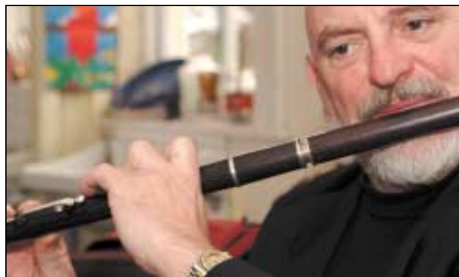
Matt Molloy, ón ngrúpa The Chieftains, ag seinm ar an bhflúit.