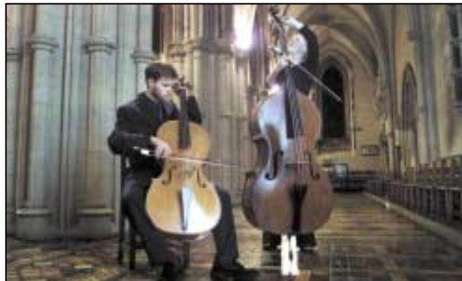
Dordveidhí (cello) agus oildord (double bass).