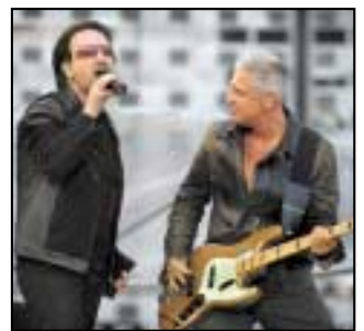
U2 ag seinm

Ó thús ama, sheinn an cine daonna ceol. Ar ndóigh, is é an guth daonna an uirlis cheoil is sine ar domhan. Fadó, rinne na chéad daoine gnúsacht (grunts) le labhairt le chéile. Nuair a rinne siad bualadh bos, rinne siad torann. Bhuaill siad stoc toll (hollow trunk) crainn, nó clocha nó cnámha móra, chun fuaimeanna éagsúla a dhéanamh. Chlúdaigh siad fráma le craiceann ainmhithe chun druma a dhéanamh. Nuair a bhuaill siad cnámha in aghaidh a chéile, rinne siad torann ar nós gligin (rattle). Fuair daoine amach go raibh siad abalta nótaí difriúla ceoil a chruthú nuair