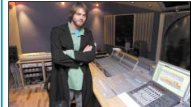
Brian McFadden sa stiúideo taifeadta.