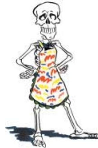
Gan chailciam, ní bheadh facla ná cnámha láidre agat.

Féach ar Cháit Ní Chnámh anseo - is fuath léi bainne ach is breá léi cáis agus iógart, mar shampla, rudaí a bhfuil bainne iontu. Cad eile ba cheart di a ithe chun aire mhaith a thabhairt dá cnámha?