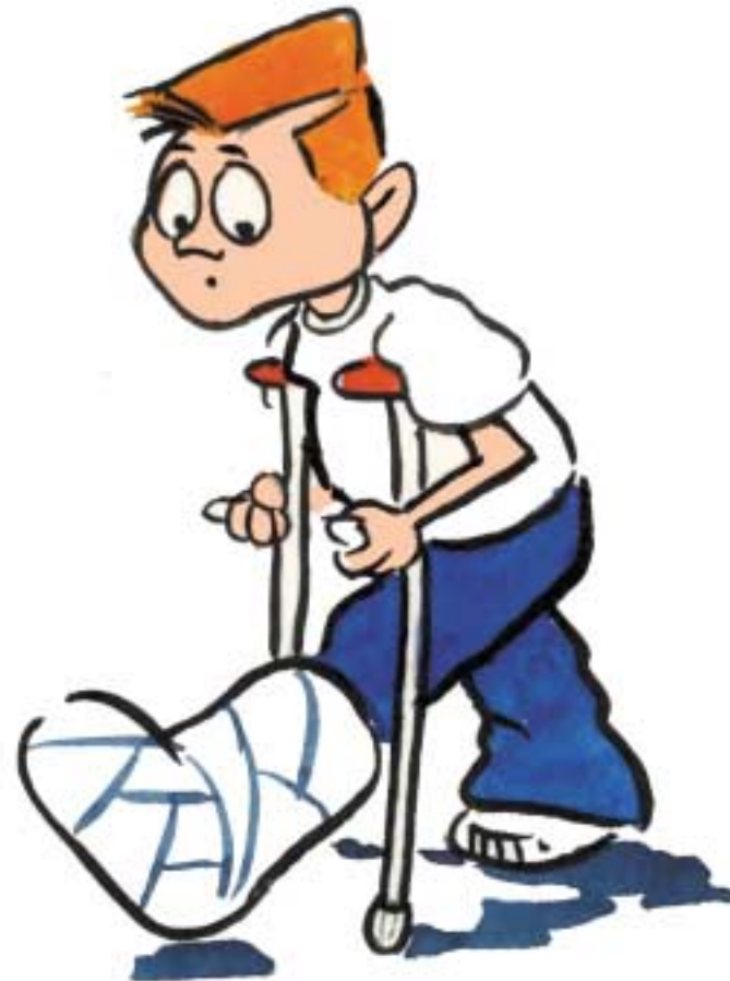
Tá an chnámh bhriste ag fás arís taobh istigh den phlástar agus cneasóidh an chos go luath.