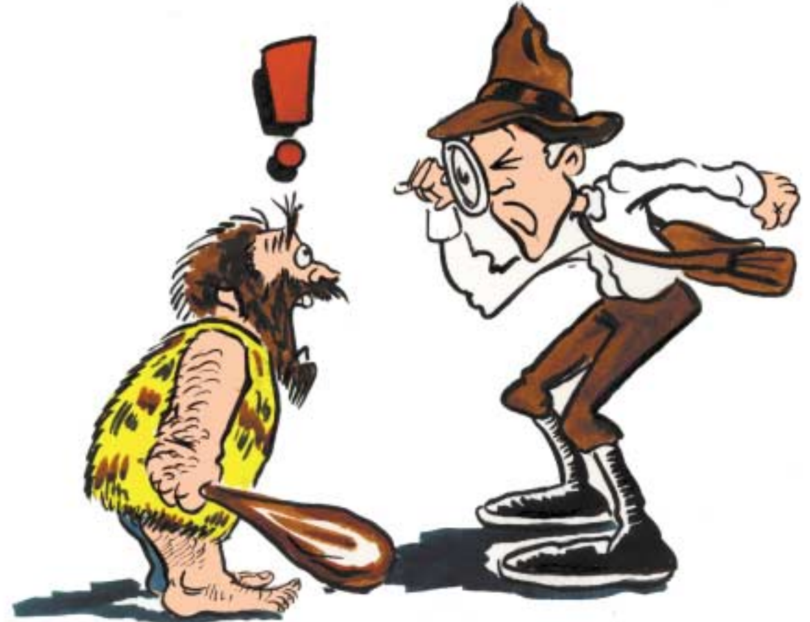
Ar bhuailéamar le chéile cheana? Measaim go n-aithnim tú