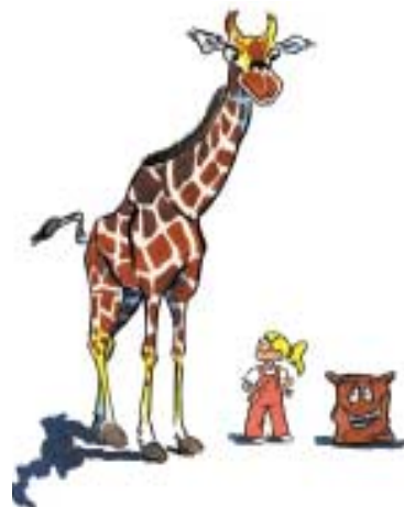
Tá an oiread céanna cnámh ag duine agus atá ag sioráif ina mhuineál. Ar ndóigh, tá cnámha an tsioráif níos faide.

◆ Gan chnámha, ní bheadh ionat ach meall putóg agus craicinn. Is ar éigean a bheifeá in ann bogadh.