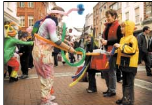
Cleasaí na mbalún

bhfuil cruth an bhalúin air, isteach sa laiteis. Nuair a bhíonn brat laiteise ar an múnla, déanann siad caolán (neck) an bhalúin. Chun é seo a dhéanamh, seolann siad an múnla trí scuabanna speisialta. Ansin, nionn siad an múnla, agus an brat laiteise air, in uisce te. Cuireann siad isteach in oigheann é ar feadh 20 - 25 nóiméad, agus ar deireadh, baineann siad an balún den mhúnla.