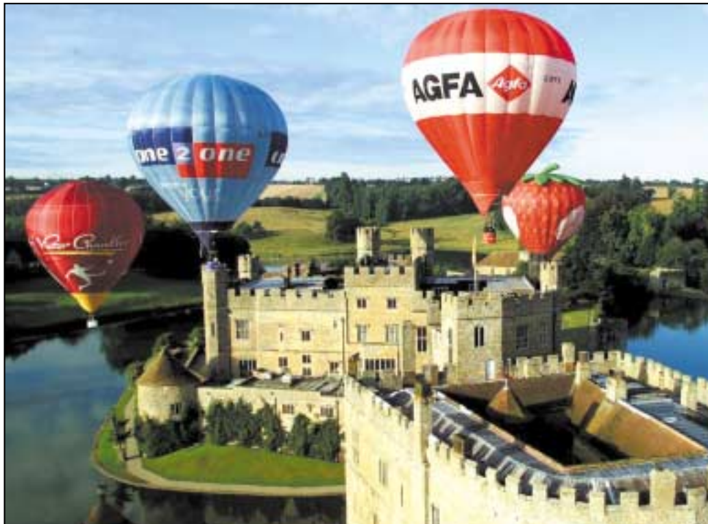
Baineann comhlachtaí úsáid as balúin the mar chóras fógraíochta

Féach an féidir leat smaoineamh ar ócáidí eile ina n-úsáideann daoine balúin.