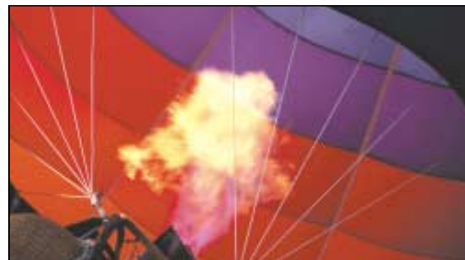
Réidh le himeacht