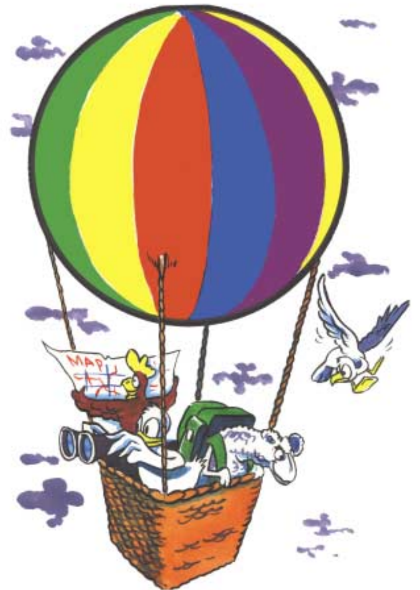
An bhfaca tú a leithéid riamh?

San eagrán seo d'Eureka, foghlaimoidh tú faoi na tascanna is féidir le balúin a dhéanamh. Chomh maith leis sin, déanfaidh tú roinnt imscrúdaithe chun breis eolais a fháil ar bhalúin.