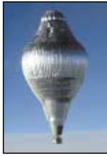
Spirit of Freedom an t-ainm a bhí ar bhalún Steve Fossett.

Nuair a thuirling Steve Fossett san Astráil i mí Iúil 2002, ba é an chéad duine é a thaistil timpeall an domhain ina aonar i mbalún te. Thóg an turas 14 lá agus 19 n-uair air agus, in amanna, bhí sé ag taisteal níos tapúla ná 320ksu. I rith an turais ní raibh ach codladh 4 huairé an chloig sa lá aige.