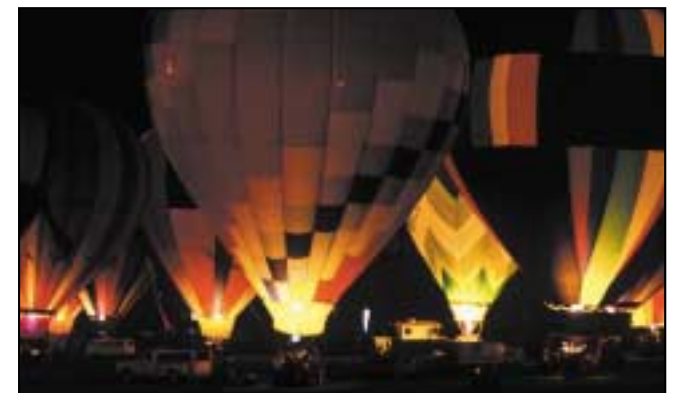
Balúin the istoiche

DÚSHLÁN BREISE: An féidir leat an carr a chur ag gluaiseacht níos faide? Níos tapúla? Níos moille?