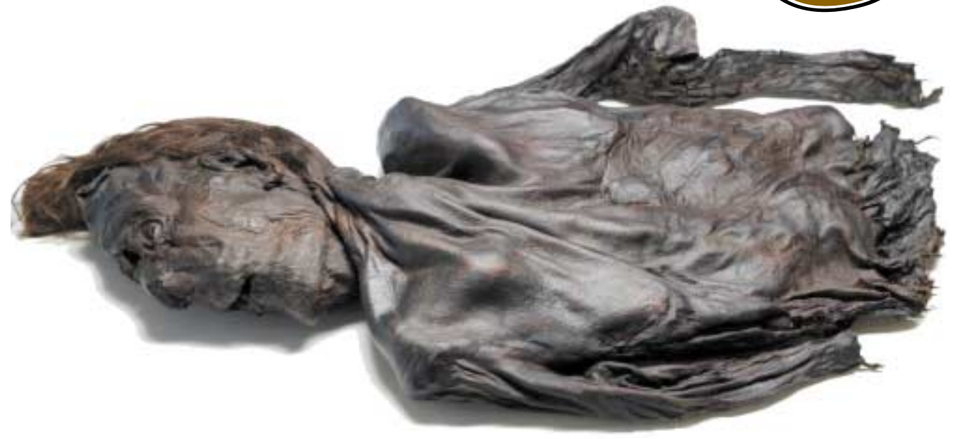
Déanfaidh mé coinne leis an ngruaigire láithreach

S an eagrán seo d'Eureka, beimid ag féachaint ar ghruaig. Gruaig ainmhithe, gruaig dhaoine, saghasanna difriúla gruaige, stíleanna difriúla, fíricí fóna agus fíricí eile a chuirfidh an ghruaig ina colgsheasamh (standing on end) ar do chloigeann – tá an t-eolas ar fad againn anseo duit!