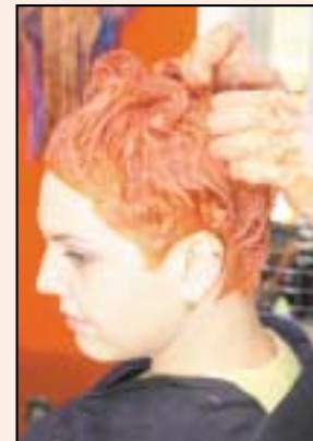
Ag cur datha i ngruaig