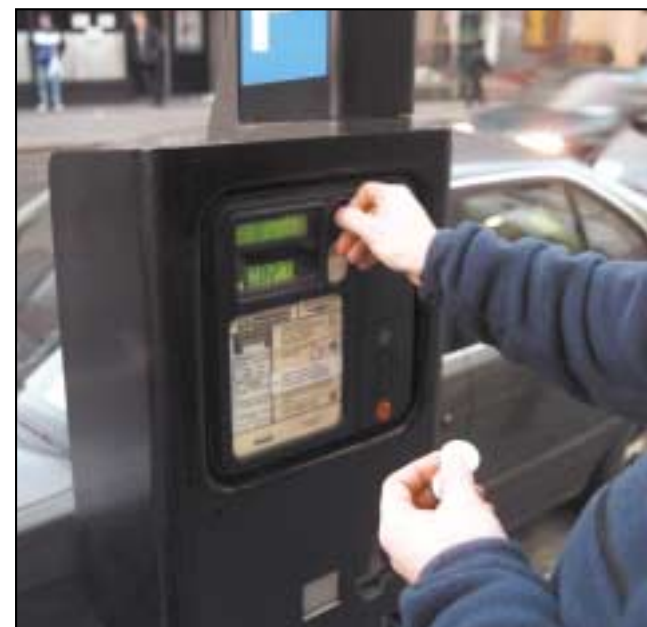
Cad dó an meaisín díola seo?

Má chuir an duine dóthain bonn isteach, gineann (produces) an meaisín comhartha agus titeann an t-earra amach.