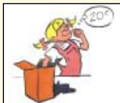
AIRE: Ná blais na boinn

Déan machnamh air seo: Ar thóg sé i bhfad ort na boinn a aithint nuair nach raibh radharc na súl agat? An raibh sé éasca nó deacair na boinn a aithint?