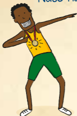
USAIN BOLT (fear fiorthapa)

Nasc na daoine cáiliúla seo lena n-áit bhreithe