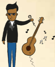
BRUNO MARS (pópórealta)